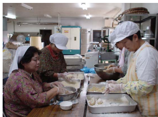
地元産バレイショ加工品（コロッケ） 作り