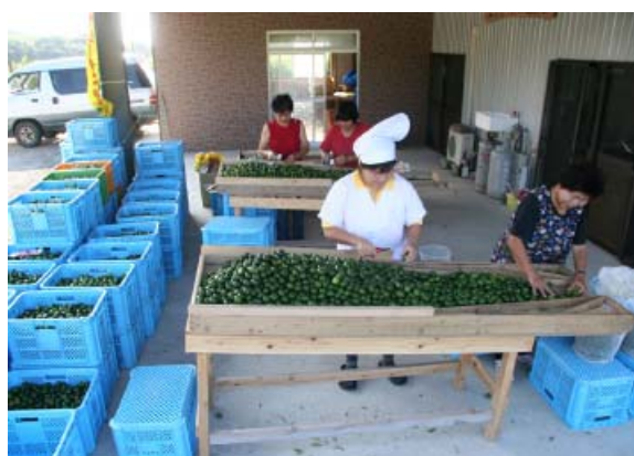
地元産みかん（ヤマ・シークニン） 選別作業