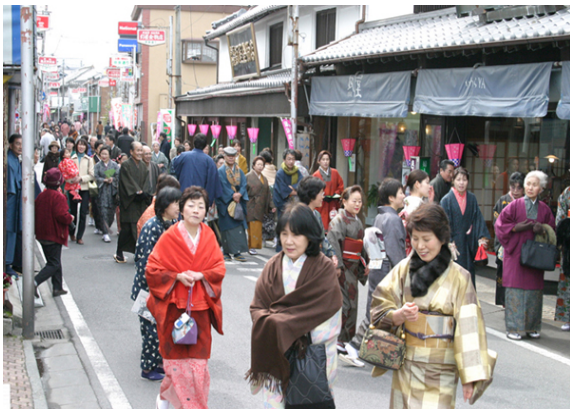
昭和の町「きもの de おひなさま巡り」