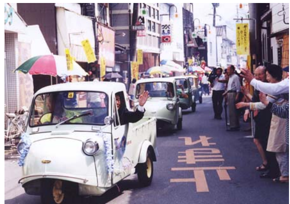
まちづくりイベント