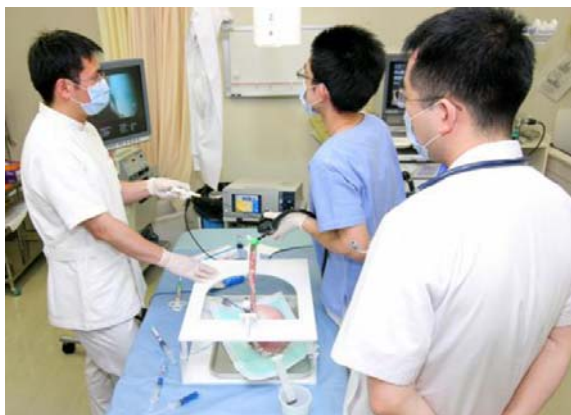
研修医の研修風景