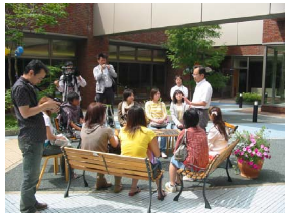
NPO と協働による札幌看護学生の 施設見学