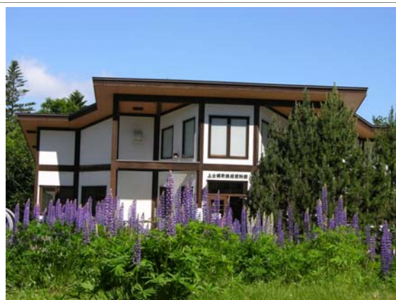
上士幌町鉄道資料館