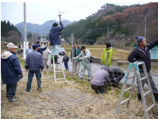
獣害防止柵設置の研修