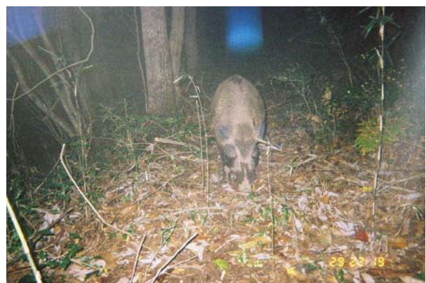
里山に出没するイノシシ