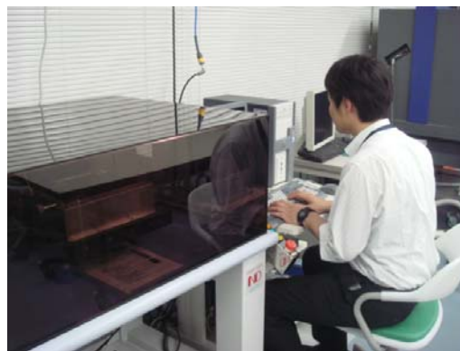
サテライトキャンパス実習風景