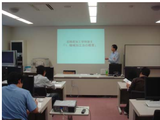
サテライトキャンパス講座風景