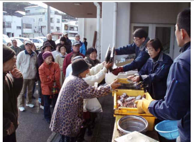
伊東港直売の賑わい