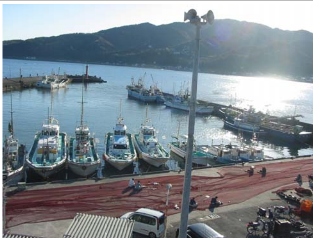
宇佐美漁港の漁船の状況