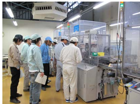
製造・生産設備メカトロニクス実習