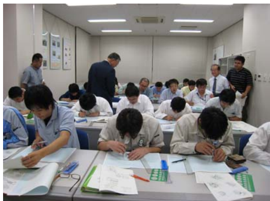
製造現場に対応した基礎製図演習