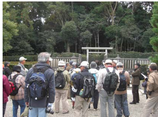
街道再発見ウォーキング