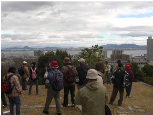
街道再発見ウォーキング