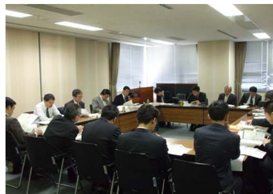
交通政策担当者等による会議の様子