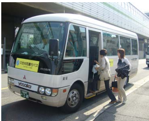
共同バス運行実験の様子