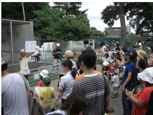
わかやまの底力・市民提案実施事業 「動物園活性化プロジェクト」