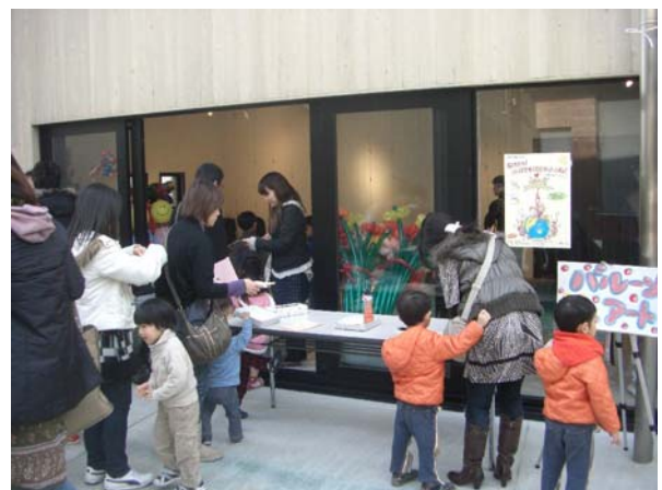
わかやまの底力・市民提案実施事業 「子育て応援フェスタ」