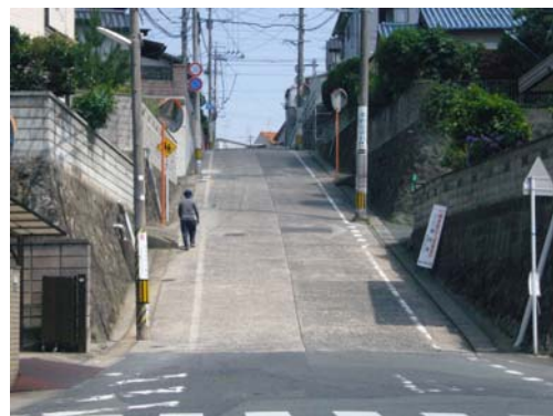
高低差のある団地