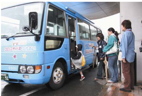
コミュニティバス