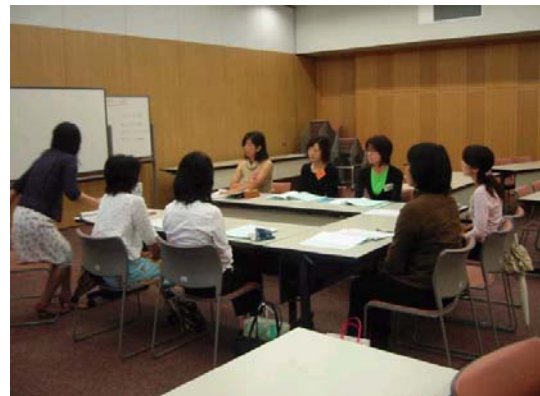
女性リーダー養成講座