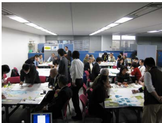
地域づくりワークショップ