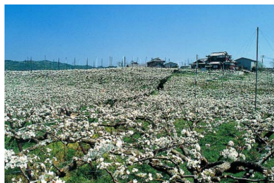
荒尾市特産の「梨」の花