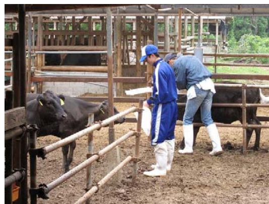
【産地化を図る黒毛和牛～南大隅牛】