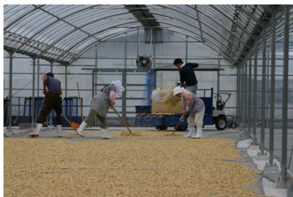
【技術者の育成を図る ～養殖魚等発育強化剤製造の様子】