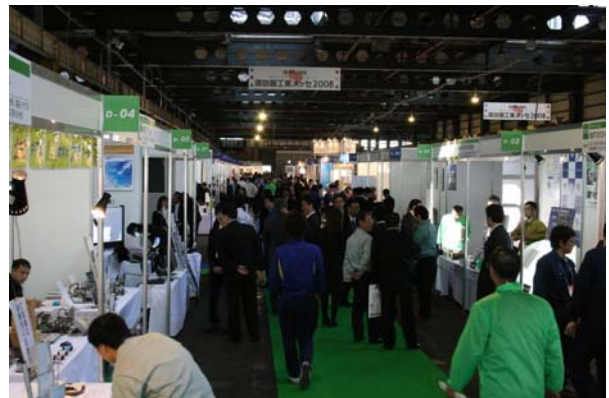
諏訪圏工業メッセ