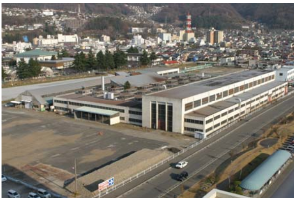
東洋バルヴ諏訪工場跡地