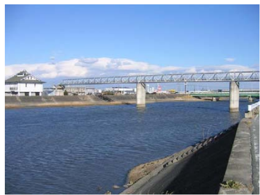
三渡川をまたぐ下水道施設