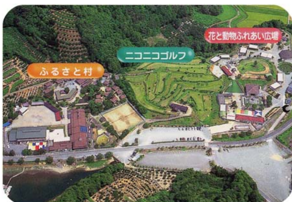
ふれあいの場【五桂池ふるさと村】