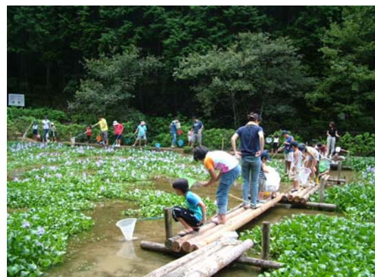
自然とのふれあい【ビオトープ】