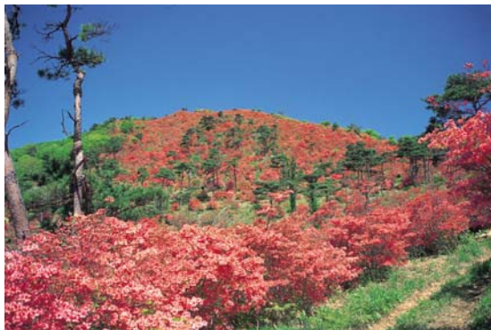
徳仙丈山のつつじ