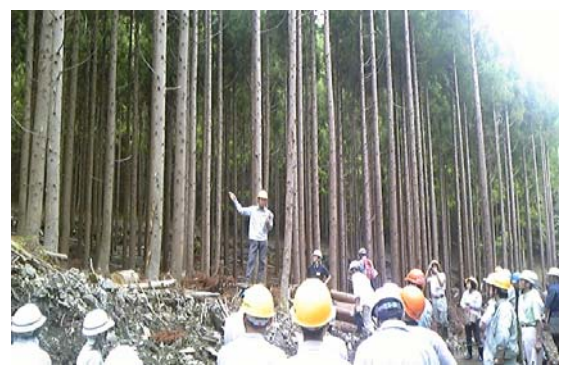
間伐のための研修