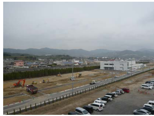
淡路市防災拠点ゾーンの建設