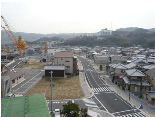
主要県道に隣接した区画整備事業