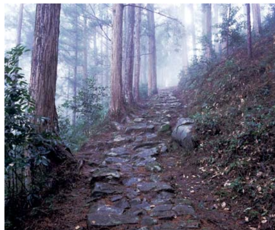
世界遺産の熊野参詣道小辺路