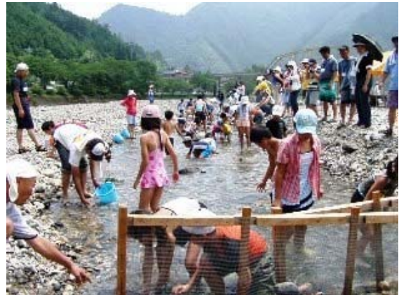
親子ふれあいキャンプ「清流アマゴつかみ」