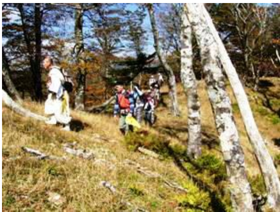
山岳信仰修験の道「大峯奥駈道」