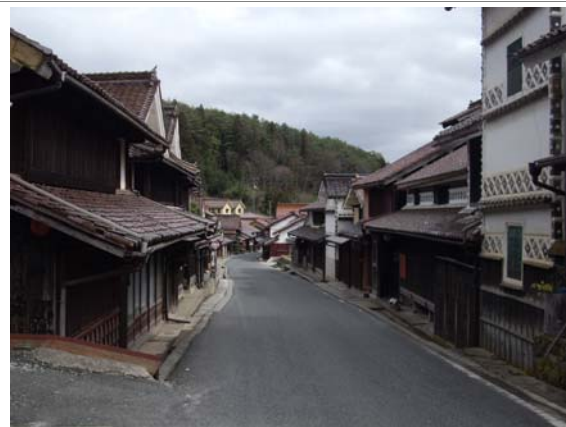
吹屋ふるさと村の風景