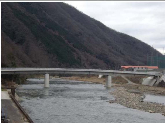
市中心部へと続くあいあい橋