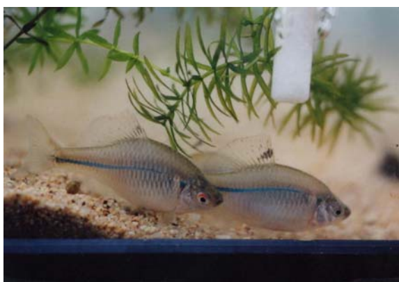
スイゲンゼニタナゴ