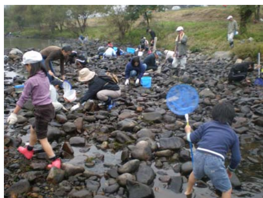
めだかの学校(かいぼり調査)