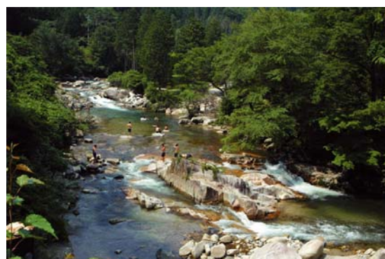
レイクパーク加茂