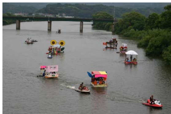
子吉川いかだ下り大会