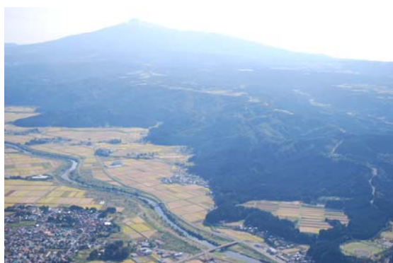
子吉川流域と集落