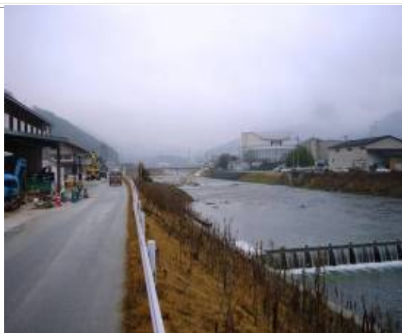
進む下水道工事と高梁川