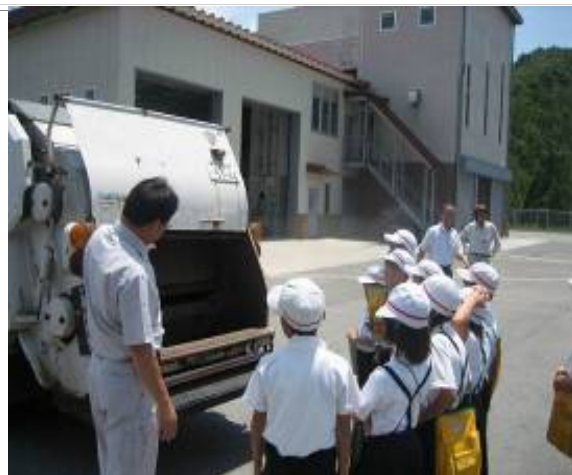
市内小学生のゴミ処理場見学