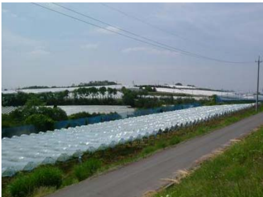
三次市内のピオーネ生産団地