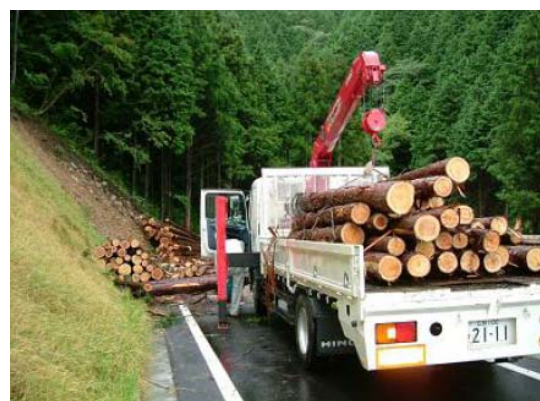
界谷小峠付近の木材搬出