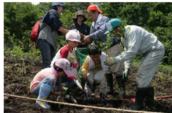
町の森づくり活動