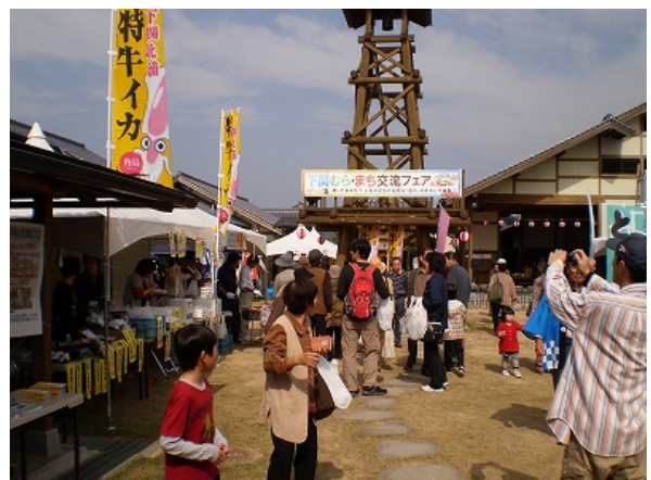
むら・まち交流フェア