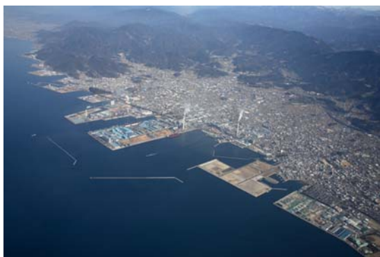
上空から見た市街地