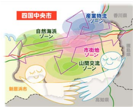
地域再生のイメージ