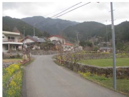
市中心部並びに森林への大規模林道へと繋がるアクセス道