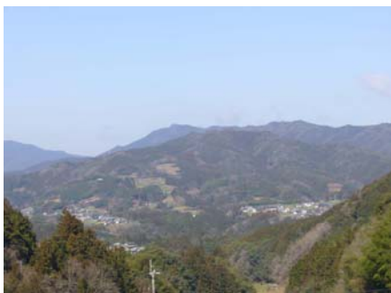
山間部に集落が点在する市の周辺部