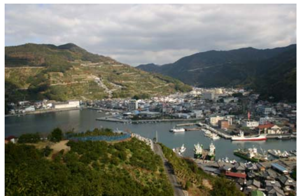
三瓶港の潮彩館で農林水産物を直売