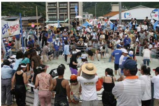
ヒラメなどのつかみどりイベント 『奥地の海のかーにばる』