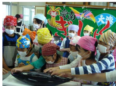
地産地消を推進するための食育 「ぎょしょく」教育