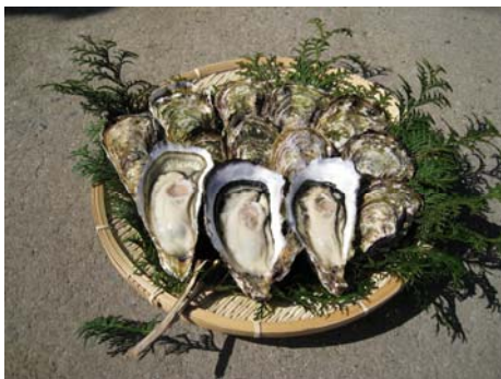
「愛なんブランド」の確立をめざす 特産品の愛南かき