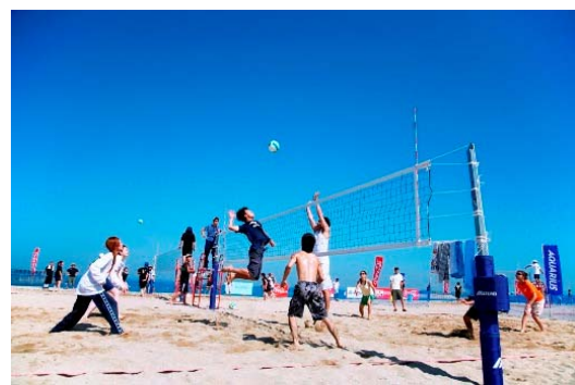
ビーチバレー大会の様子