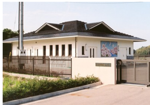
小山田甦水センター