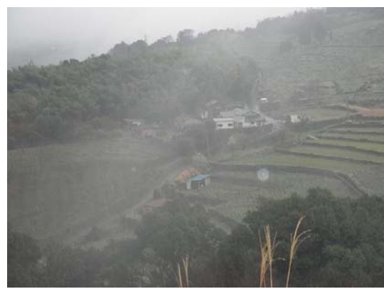
市道大野原・小松堀線