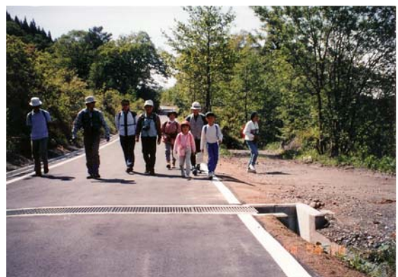
地域間（市街地と山間部）の交流