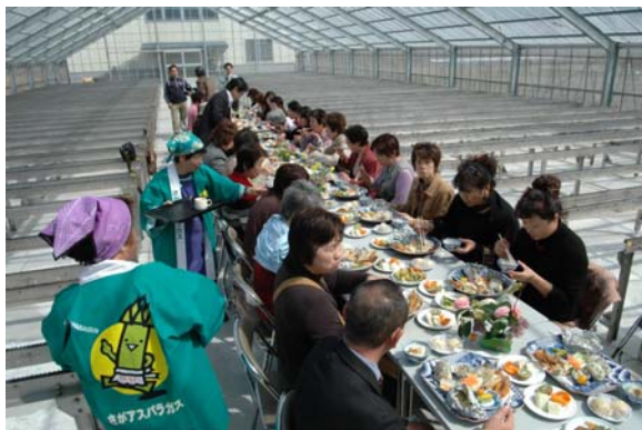
畑の中のレストラン