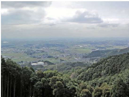
みやき町の山と農とまち