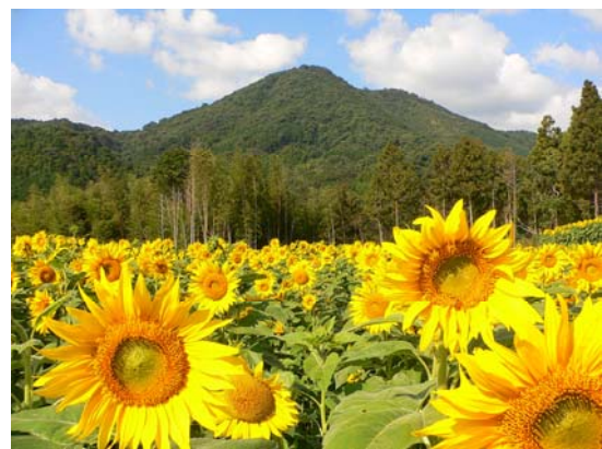
山田地区棚田の秋に咲く「ひまわり」