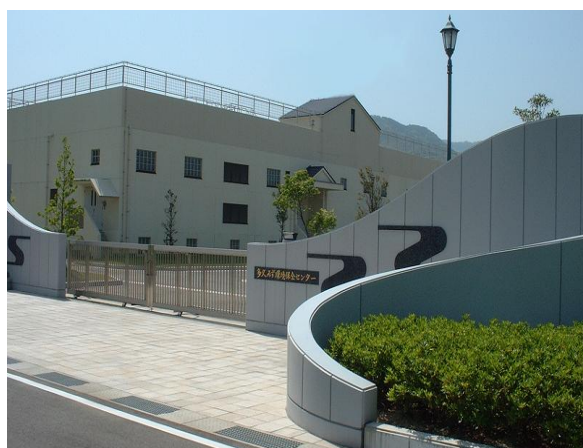
多久みず環境保全センター (污水处理場)