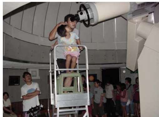
都市との交流イベント (さかもと八竜天文台)