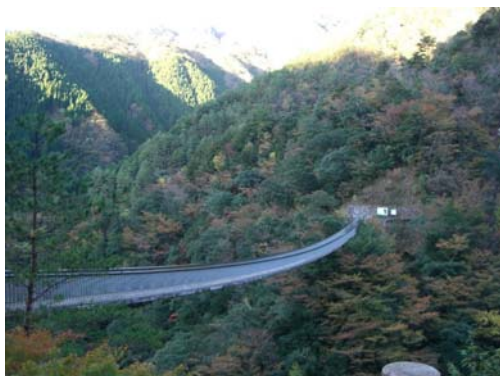
癒しの空間である森林景観