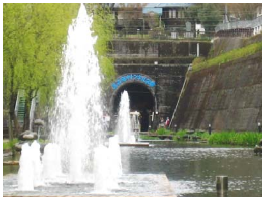
高森湧水トンネル公園