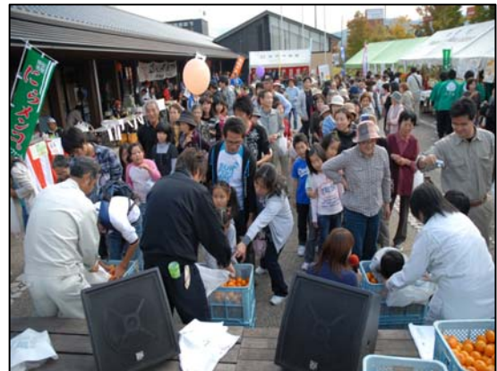
都市と農村の交流イベント