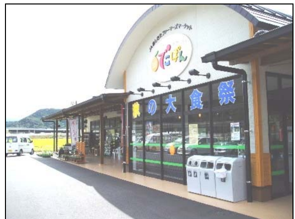
ファーマーズマーケット