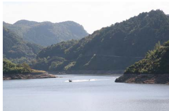
山国川水系ダム湖