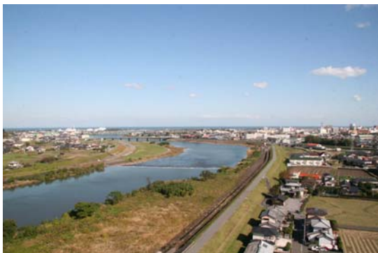
山国川と中津市街地