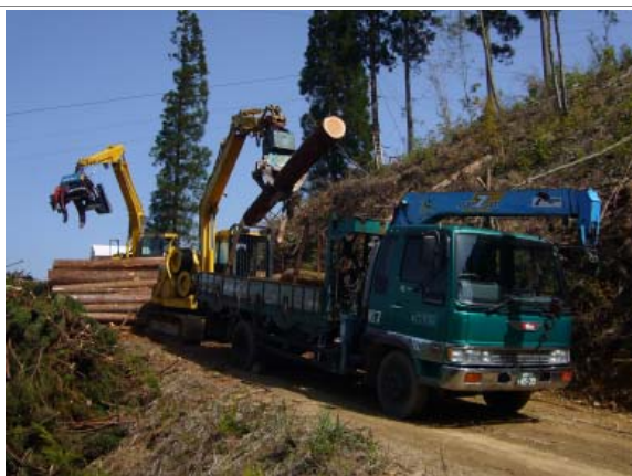
木材の搬出 ((財) ウッドピア諸塚)