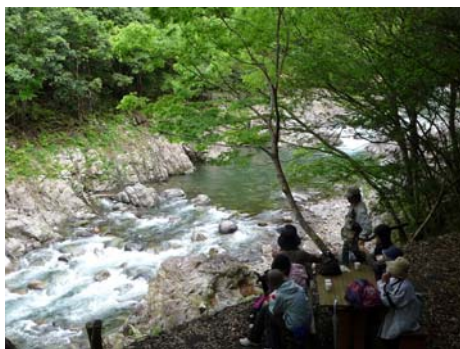
森林セラピー基地