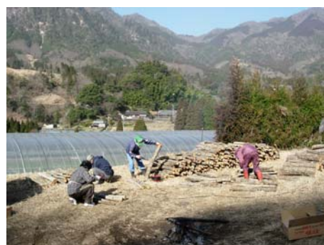
町内産の原木を使用した 椎茸コマ打ち作業