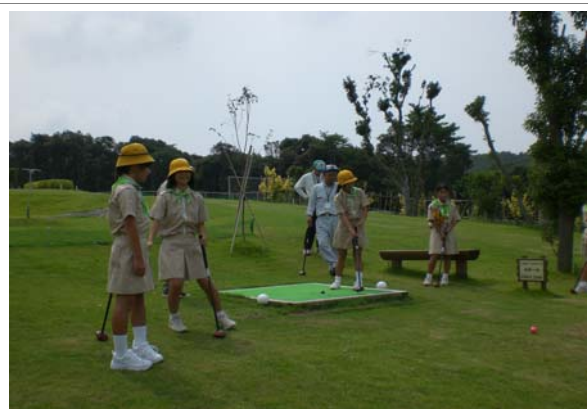
パークゴルフ大会(緑の少年団交流会)