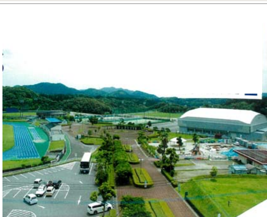
総合運動公園施設