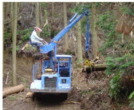
路網整備による間伐材の搬出