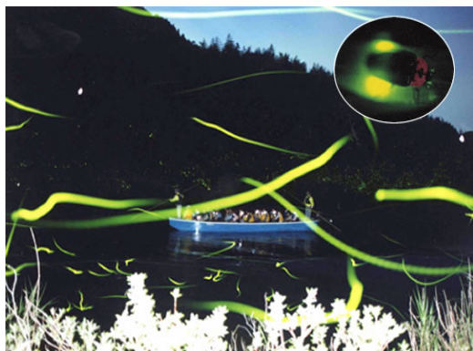
地域総合交流(ホタル鑑賞)